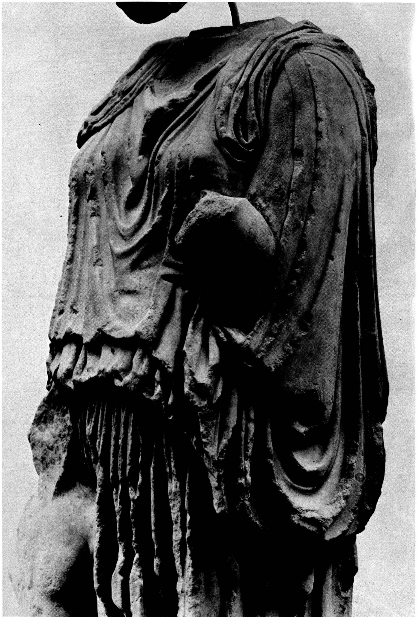
Planche 6. Athènes. Musée de l'Acropole. Détail de la Procné d'Alcamène.