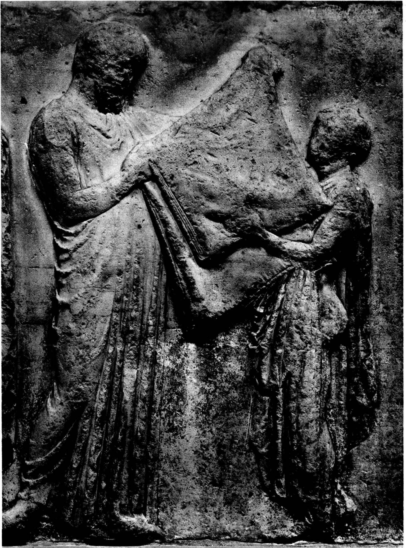
Planche 4. Londres. British Museum. Frise est du Parthénon V 34. 35.