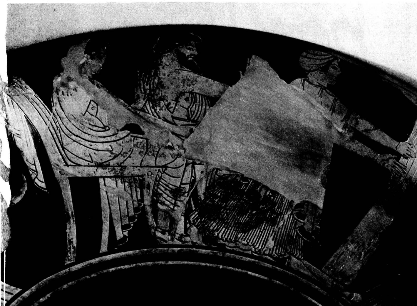
Planche 1. Francfort/Main. Liebieghaus. Coupe du peintre de Castelgiorgio.